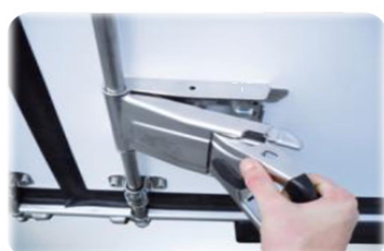
Нова ручка "Easy Handle" з одним рухом, на задніх дверях