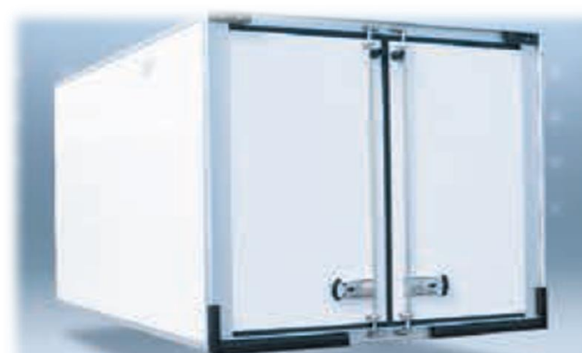
Композитні панелі (харчовий гелеобразний шар - поліефір - поліуретан), оснащені алюмінієвими вставкам