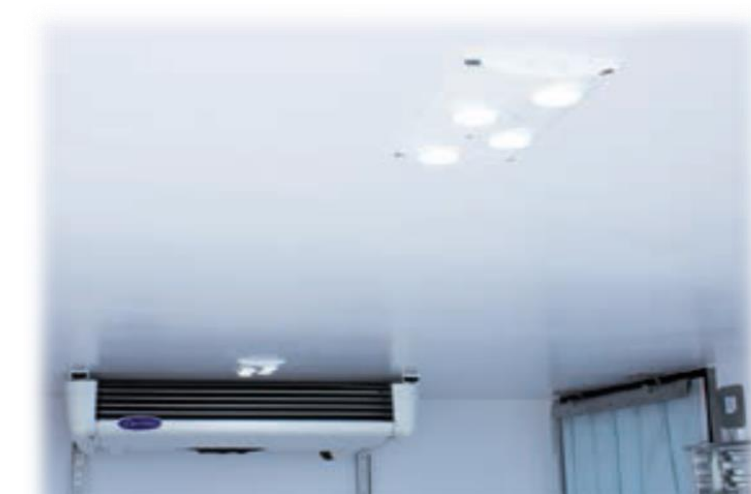
Світлодіодний світильник з перемикачем всередині кабіни